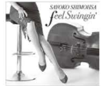
2nd アルバム 「Feel Swingin'」