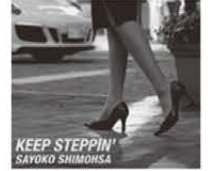
1st アルバム 「KEEP STEPPIN'」

2013年に縁あって、学芸大学駅のJazz Bar A-trainを前マスターより引き継ぎ多くのミュージシャンとの出会いに恵まれ、60才を過ぎて2020年にファーストアルバム「KEEP STEPPIN'」(キープ・ステッピン)を、2022年7月にセカンドアルバム、ベースとDuoの「Feel Swingin'」(フィール・スウィングイン)をリリース。